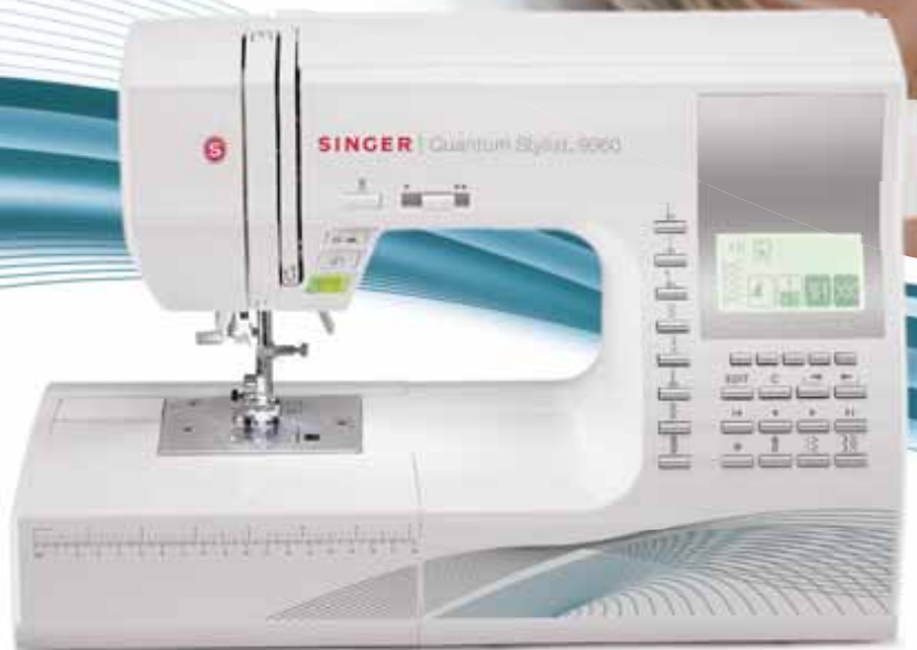
Quantum Stylist™ 9960