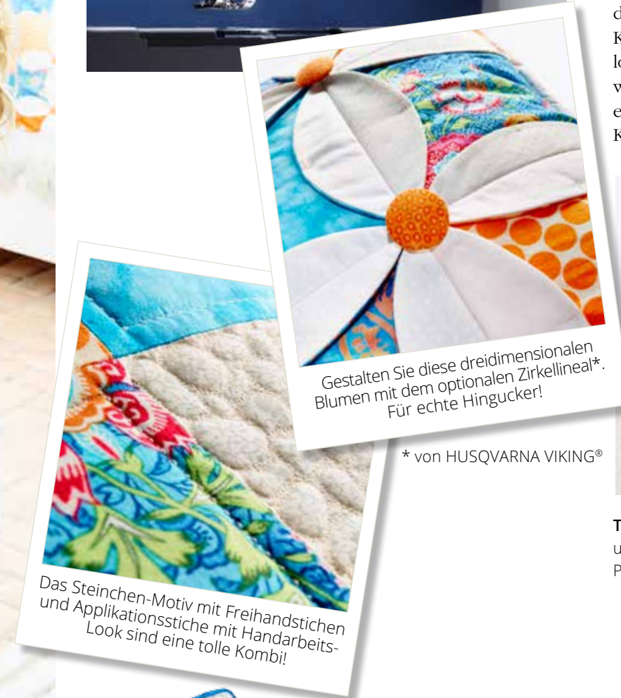
Gestalten Sie diese dreidimensionalen Blumen mit dem optionalen Zirkellinea!*. Für echte Hingucker!

Das Ausrichten und Nähen von Knopflöchern ist dank der SAPPHIRE™ keine Herausforderung mehr! Knopflochlänge eingeben, Nähfuß anbringen und losnähen – ist das nicht schön? Beide Knopflochraupen werden in gleicher Richtung genäht, so erhalten Sie exakte Nähergebnisse. Ihnen stehen sogar mehrere Knopflocharten zur Auswahl.